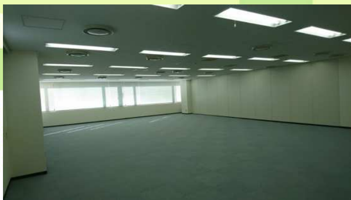
レイアウト自在の使いやすい整形空間