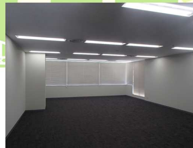
3階北室 (※今回空室となる8階北室と同区画)